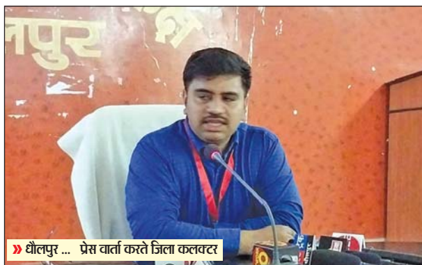
धौलपुर ... प्रेस वार्ता करते जिला कलेक्टर