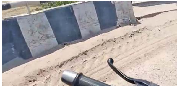
हो गई है

धौलपुर। धौलपुर में नेशनल हाईवे 44 पर रोड़ और पुलों के दोनों ओर इतनी मिट्टी रेत साइट से जमा हो गयी है जिसके वजह से दुर्घटना होने की संभावना बनी रहती है, नेशनल हाईवे पर मौरोली रोड़ के उपर बने ब्रिज, वाटर वर्क्स के पास ब्रिज, मिडवे के सामने, राजाखेड़ा बाईपास के पास जिनते ओवर ब्रिज बने हुये है। इन सभी ब्रिजों के रोड़ के दोनों ओर काफी मिट्टी व रेत जमा