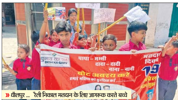
धौलपुर ... रैली निकाल मतदान के लिए जागरूक करते बच्चे

धौलपुर। द सांता किड्स स्कूल के नन्हे मुन्ने बच्चों ने रैली के माध्यम से लोगों को 19 अप्रैल को आगामी लोकसभा चुनाव में मतदान करने के लिए जागरूक किया। बच्चों ने रैली के माध्यम से सभी से निवेदन किया कि दादा-दादी नाना नानी और मम्मी पापा सभी लोग वोट डालने जरूर जाएं बच्चों ने लोगों को समझाया की हम नन्हे मुन्ने बच्चों का भविष्यआपके द्वारा चुनी गई सरकार के हाथ में ही है यदि आप लोग मतदान नहीं करते हैं तो आपको