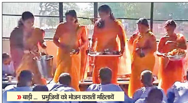
बाड़ी ... प्रभुजियों को भोजन कराती महिलाएँ