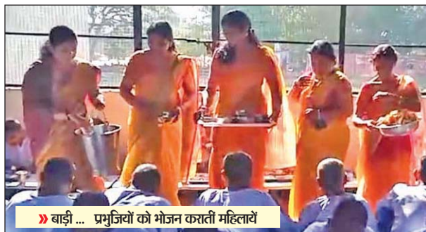
बाड़ी ... प्रभुजियों को भोजन कराती महिलाएँ