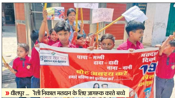
धौलपुर ... रैली निकाल मतदान के लिए जागरूक करते बच्चे

धौलपुर। द सांता किड्स स्कूल के नन्हे मुन्ने बच्चों ने रैली के माध्यम से लोगों को 19 अप्रैल को आगामी लोकसभा चुनाव में मतदान करने के लिए जागरूक किया। बच्चों ने रैली के माध्यम से सभी से निवेदन किया कि दादा-दादी नाना नानी और मम्मी पापा सभी लोग वोट डालने जरूर जाएं बच्चों ने लोगों को समझाया की हम नन्हे मुन्ने बच्चों का भविष्यआपके द्वारा चुनी गई सरकार के हाथ में ही है यदि आप लोग मतदान नहीं करते हैं तो आपको