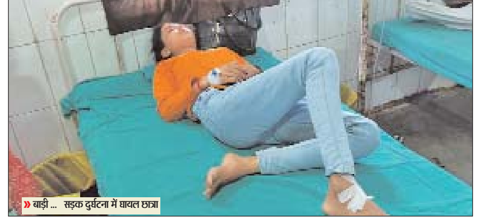
बाड़ी ... सड़क दुर्घटना में घायल छात्रा