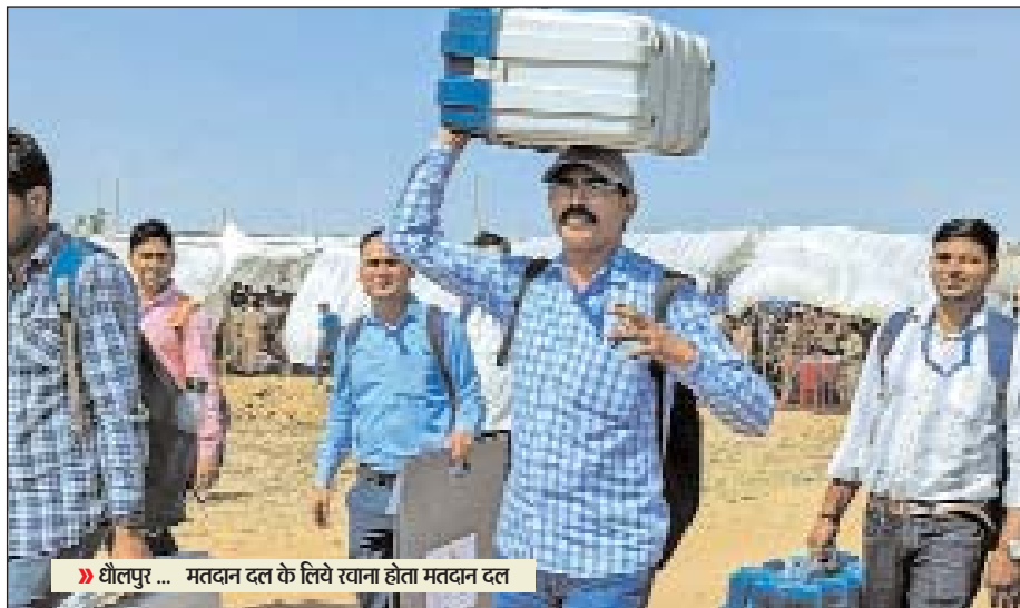
धौलपुर ... मतदान दल के लिये रवाना होता मतदान दल