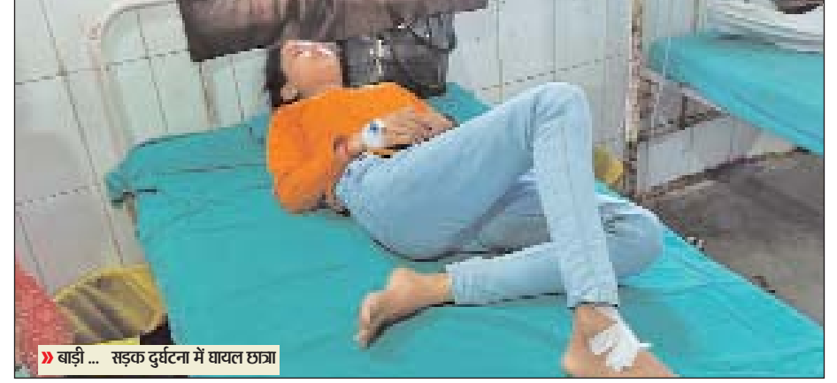
बाड़ी ... सड़क दुर्घटना में घायल छात्रा