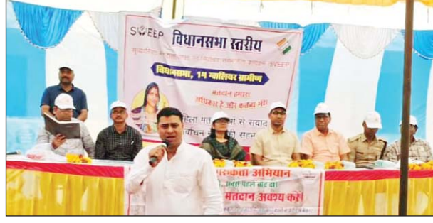
रहे मतदाताओं के साथ संवाद कर उनका उत्साहवर्धन किया। कार्यक्रम के दौरान नुक्रड नाटक, रंगोली व मेहंदी प्रतियोगिता, कविता और लोक गीतों