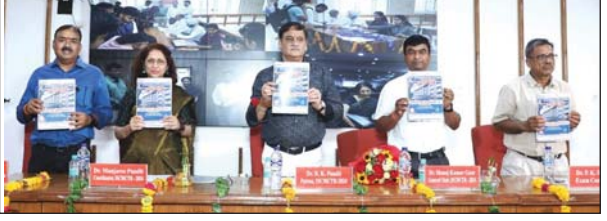
एमआईटीएस में टी व्यूएम विषय पर आयोजित दो दिवसीय राष्ट्रीय संगोष्ठी में विभिन्न संस्थानों से आए प्रतिभागियों ने नौ खल में 72 प्रस्तुतियों के माध्यम से कार्यस्थल पर किए गए सुधारों को प्रस्तुत किया।