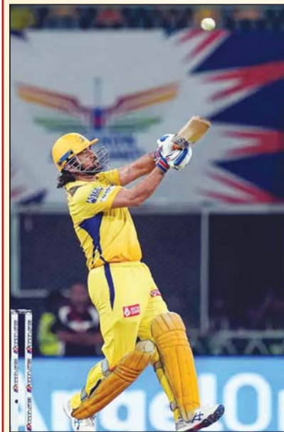
लखनऊ • एजेंसी