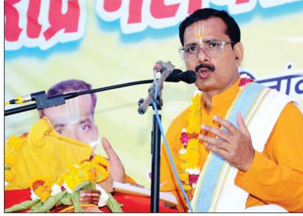
उनका विरोधी हो गया। उसके बाद उसने देवताओं पर चढ़ाई की और सारे देवताओं को उनके स्थान से निकाल दिया। इस कारण यह देवताओं का वैरी हो गया। अंत में युद्ध में भगवान शंकर के हाथों मारा गया।

बेटा था और यह भी ब्रह्मा से वरदान पाकर के बहुत ही शक्तिशाली हो गया। जब इसको पता चला की राहु का शिरच्छेद विष्णु ने किया है और वह इन्होंने त्रिलोकी में हलकाकर मचा दिया। देवताओं का राज्य छीन लिया। यह शिव भक्त भी थे और नित्य नियम से वेद और कर्मकांड के मार्ग पर चलकर अपना जीवन प्रजापालन करते थे। परंतु देवताओं से द्वेष रखते थे। इसलिए देवता परेशान हो गए। अतः देवताओं की प्रार्थना पर भगवान विष्णु ने कपाली का वेश रखकर इन्हें वेद विरुद्ध मार्ग की दीक्षा दी और इसका शिव भक्ति से मन हटा दिया। उन्हें वेद विरुद्ध मार्ग पर कर दिया। इस तरह अपने मार्ग से च्युत होकर इन तीनों दैत्यों का विनाश करने के लिए भगवान शंकर आए और उन्होंने उनके तीनों नगरो को भस्म कर दिया। इस तरह इन तीनों का नाश हुआ।