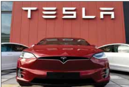
से भी 285 कर्मचारियों को नौकरी से निकाला जाएगा।

टेस्ला ने मंगलवार को मार्च तिमाही का परिणाम जारी किया है। इसके साथ ही यह जानकारी भी दी गई है कि कंपनी जल्द ही कर्मचारियों की छंटीनी करने पर विचार कर रही है। माना जा रहा है कि 6020 कर्मचारियों को नौकरी से निकाला जा सकता है। मूल रूप से यह छंटीनी कैलिफोर्निया और टेक्सास में की जा सकती है। कैलिफोर्निया में 332 लोगों को नौकरी से निकाला जाएगा। वहीं टेक्सास में 2688 लोग बेरोजगार हो सकते हैं। न्यूयॉर्क स्थित बफेलो प्लांट