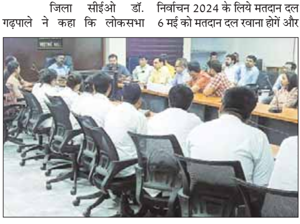
जिला सीईओ डॉ. निर्वाचन 2024 के लिये मतदान दल गढ़पाले ने कहा कि लोकसभा 6 मई को मतदान दल खाना होंगे और

-हिन्दुस्तान एक्सप्रेस न्यूज-मुरैना। लोकसभा निर्वाचन 2024 के दौरान गमी को ध्यान में रखते हुये स्वास्थ्य विभाग 06 एवं 07 मई को पॉलीटेक्निक कॉलेज मुरैना में अस्थाई हॉस्पिटल बनाये। यह निर्देश मुख्य कार्यपालन अधिकारी जिला पंचायत डॉ. इच्छत गढ़पाले ने गत दिवस कलेक्ट्रेट सभागार मुरैना में स्वास्थ्य से जुड़े अधिकारियों को दिये। इस अवसर पर मुख्य चिकित्सा एवं स्वास्थ्य अधिकारी डॉ. राकेश शर्मा, सिविल सर्जन डॉ. गजेन्द्र सिंह तोमर सहित अन्य स्वास्थ्य अधिकारी, कर्मचारी उपस्थित थे।