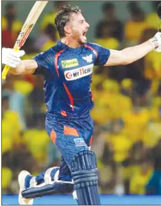
LSG का चेपाँक स्टेडियम में सबसे बड़ा चेज

LSG ने IPL में CSK के खिलाफ दूसरा सबसे बड़ा रन चेज किया है। टीम ने 211 रन का टारगेट हासिल किया। इससे पहले भी टीम ने मुंबई के मैदान पर साल 2022 में CSK के खिलाफ 211 रन चेज किए। CSK के खिलाफ सबसे बड़ा टारगेट MI ने चेज किया है। MI ने साल 2021 में 219 रन का टारगेट दिल्ली के मैदान पर चेज किया था। इस मुकामले में कीरोन पोलार्ड ने 34 बॉल में नाबाद 84 रन की पारी खेली थी।