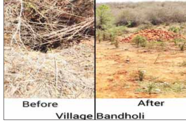
Before Village Bandholi After