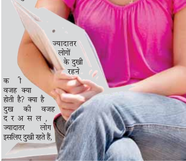
ज्यादातर लोगों के दुखी रहने का वजह क्या होती है? क्या है दुख की वजह दरअसल, ज्यादातर लोग इसलिए दुखी रहते हैं,

दातर लोग ऐसा ही सोचते हैं। पर सच यह है कि यह पूरी तरह सही नहीं है। धन-संपदा आने के बाद भी खुशी नहीं आ पाती। अगर पैसे से ही खुशी खरीदी जा सकती तो डिप्रेशन को अमीरों की बीमारी नहीं कहा जाता। तब खुशहाली की सूची में भूटान जैसे गरीब देश शीर्ष पर नहीं होते। फिर कैसे आ सकती है खुशी?