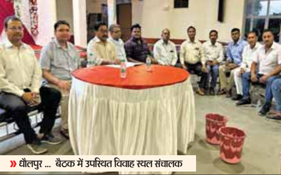
धौलपुर ... बैठक में उपस्थित विवाह स्थल संवाहक