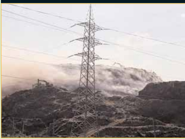
3,000 टन का उचित तरीके से निपटान नहीं किया जाता है। हैरानी

की बात है कि ठोस कचरा प्रबंधन नियम 2016 को लागू हुए आठ साल हो गए हैं, लेकिन दिल्ली में इसका कोई पालन नहीं हो रहा है। नतीजतन कचरे का पहाड़ दिन-ब-दिन बढ़ता ही जाता है। पूरे देश में हर साल 277 अरब किलो कचरा निकलता है, यानी प्रति व्यक्ति करीब 205 किलो कचरा निकलता है। इसमें से केवल 70 फीसदी ही इकट्ठा किया जाता है। बाकी जमीन और पानी में फैला रहता है। इकट्ठा किए गए कचरे में से आधा या तो खुले में फेंक दिया जाता है या उसे जमीन में दबा दिया जाता है।