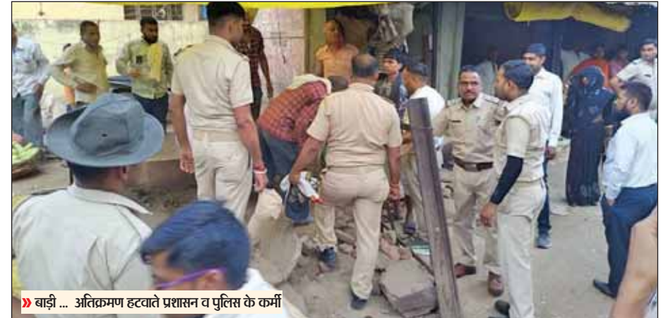
बाड़ी ... अतिक्रमण हटवाते प्रशासन व पुलिस के कर्मी

मकान का छज्जा टूटते ही मौके पर कोहराम मच गया। घटना के बाद स्थानीय लोग सभी घायलों को लेकर जिला अस्पताल पहुंचे, जहां इमरजेंसी में इव्यूटी डॉक्टर की देखरेख में सभी घायलों का ट्रौमा वार्ड में इलाज किया जा रहा है।