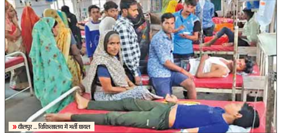
धौलपुर ... चिकित्सालय में गर्मी घायल