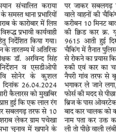
कागजात न होना बताया आरोपी का कृत्य धारा 34 (2) आबकारी एक्ट के तहत दण्डनीय पाया जाने से उक्त 10 पेटी मदिरा प्लेन मात्रा (90 बल्क लीटर) कीमती करीबन 50000/- रुपये एवं लाल रंग की क्रिड कार क्रमांक यूपी 85 बीसी 9615 कीमती करीबन 450000/- रुपये इस प्रकार कुल मशरूका कीमती करीबन 500000/- रुपये का मौके पर समक्ष पंचान विधिवत जप्त आरोपी को गिरफ्तार कर थाना वापसी पर उक्त आरोपी के विरुद्ध धारा 34(2) आबकारी एक्ट के तहत अपराध पंजीबद्ध कर विवेचना में लिया गया।

रंग के फार्मट्रेक कम्पनी के ट्रेक्टर जिस पर रजिस्ट्रेशन नम्बर अंकित नहीं है एवं ट्रेक्टर के गियर के पास बाड़ी पर लगी प्लेट पर FT-45 LMX, T-2221808, E-2225149 गुदा होकर अंकित है एवं उसमें लगी ट्रॉली जिस पर बायों तरफ सिकरवार कृषि फार्म पचेखा एवं बीच में उद्योग इण्ड. राठौर अम्बाह लिखा है। ट्रॉली के अन्दर खाकी रंग के कुल 30 कार्डन रखे मिले, जिन्हें खोलकर चैक किया तो 24 कार्डनों में देशी मदिरा मसाला एवं 6 कार्डनों में देशी मदिरा प्लेन होना पाई गई। प्रत्येक कार्डन में 50-50 क्रांटेर एवं प्रत्येक क्रांटेर में 180 एमएल शराब होना पाया गया। बाद उक्त शराब व ट्रेक्टर के संबंध में मौके पर कार्यवाही के लिए नैपरी गांव तरफ से बुजगाढ़ी रोड पर भगाकर ले जाने लगा, जिसे हमराही फोर्स की मदद से पीछा करते हुये रेलवे का चालक कार को रोकने में सफल हुए। बाद कार चालक को कार से उतारकर नाम पता कर उक्त कार की तैलाशी ली तो पीछे वाली लंबी सीट के ऊपर