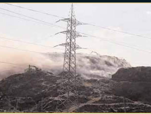
3,000 टन का उचित तरीके से निपटान नहीं किया जाता है। हैरानी