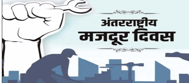
अंतरराष्ट्रीय मजदूर दिवस

पहचानने का दिन है। इस तरह धीरे-धीरे पूरी दुनिया में 1 मई को मजदूर दिवस या कामगार दिवस के रूप में मनाने की शुरुआत हुई। श्रम अधिकारों के इतिहास में एक महत्वपूर्ण घटना का स्मरण दिवस है। भारत में यह दिन 1923 में अस्तित्व से आया। हालांकि मजदूर आंदोलन