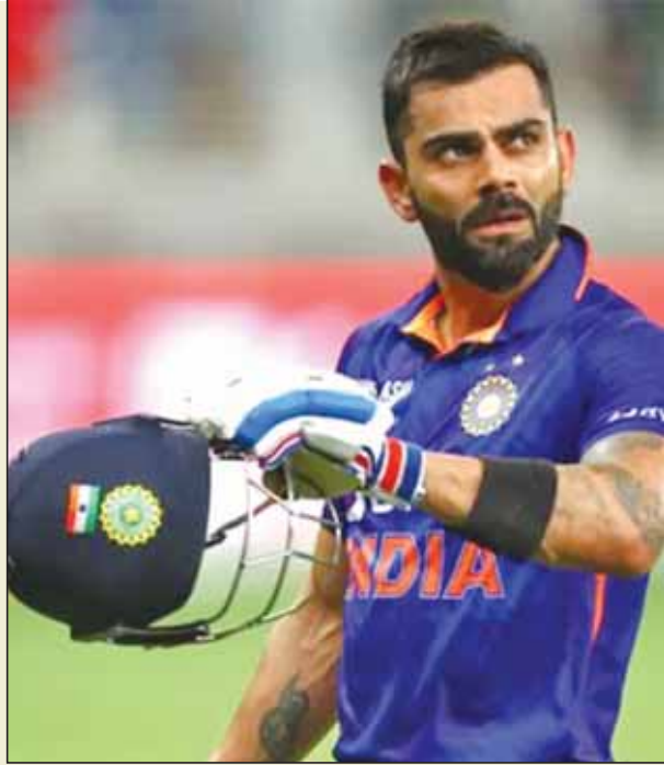
से 500 रन के साथ टूर्नामेंट में सबसे ज्यादा रन बनाने वाले बल्लेबाजों की लिस्ट में शामिल हैं। रोहित को मिल जाएगा समय

जियो सिनेमा से बात करते हुए अजय जड़ेजा ने मानना है कि टी20 वर्ल्ड कप 2024 में भारतीय पारी का आगाज रोहित शर्मा के बजाया, विराट कोहली करें। उन्होंने इसके पीछे का कारण भी बताया। अजय जड़ेजा ने कहा कि आईपीएल में आरसीबी के लिए पारी की शुरुआत करते हुए जबरदस्त फार्म में हैं। अभी तक कोहली 10 पारियों में 71.42 की औसत और 147.49 की स्ट्राइक रेट