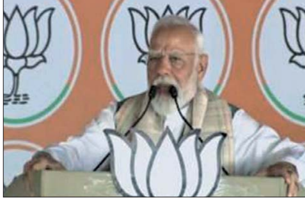
अपने बच्चों के लिए पैसा जमा कर रहे हैं। मेरे पास ना साइकिल है ना घर। मेरा परिवार और वारिस तो आप लोग

आर.एन.एस. पलामू। पीएम मोदी ने शनिवार 4 मई को पलामू और गुमला में जनसभा की। पलामू में पीएम ने भीड़ देखकर कहा कि आप लोगों ने झुंझूक कांग्रेस को दिन में तारे दिखा दिए। पीएम मोदी ने लोगों को वोट की ताकत बताई। उन्होंने कहा कि आपके एक वोट से आज राम मंदिर बना। जम्मू-कश्मीर में आपके एक वोट से 370 हट गई। पीएम ने कहा कि आपके आशीर्वाद से मोदी पर 25 साल में एक पैसे का भ्रष्टाचार का आरोप नहीं लगा है। मोदी मौज नहीं मिशन के लिए पैदा हुआ है। परिवारवाद पर हमला करते हुए प्रधानमंत्री ने कहा कि ये लोग