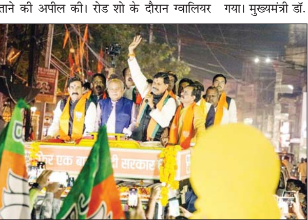
की सड़कें फिर एक बार मोदी सरकार और अबकी बार 400 पर के नारों से गूंज उठी। रोड शो के दौरान रथ पर सवार पार्टी नेताओं का जगह-जगह भव्य स्वागत किया