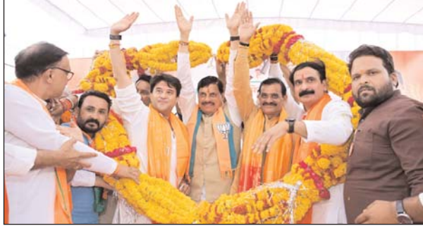
नहीं करना है। राहु-केतु की तरह कमलनाथ और दूसरे दिग्बिजय सिंह, कांग्रेस पार्टी में भी दो ग्रह हैं एक जिन्होंने कांग्रेस पार्टी को पूरी तरह

मुख्यमंत्री डॉ. मोहन यादव ने भिंड, गुना, ग्वालियर लोकसभा क्षेत्रों में आयोजित विभिन्न जनसभाओं को संबोधित किया। इस दौरान गुना में भाजपा प्रदेश व सांसद विष्णुदत्त शर्मा एवं केंद्रीय मंत्री व पार्टी प्रत्याशी ज्योतिरादित्य सिंधिया ने भी सभा को संबोधित किया