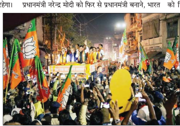
को 2047 तक विकसित राष्ट्र तथा वैश्विक महाशक्ति बनाने के लिए पार्टी नेताओं ने शनिवार को ग्वालियर में रोड शो के माध्यम से जनता से आशीर्वाद मांगा तथा पार्टी प्रत्याशी