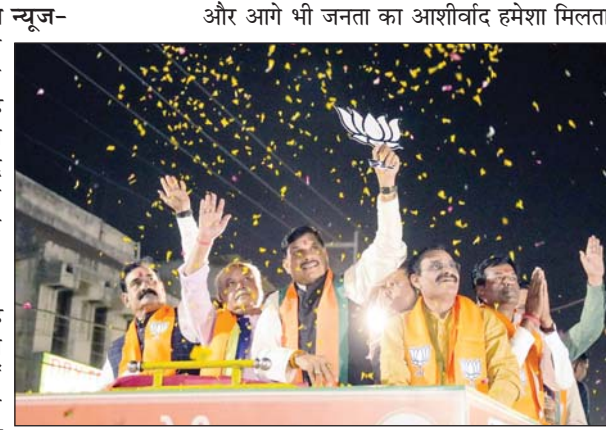
भारत को विकसित राष्ट्र, मोदी जी को फिर प्रधानमंत्री बनाने पार्टी नेताओं ने मांगा जनता से आशीर्वाद