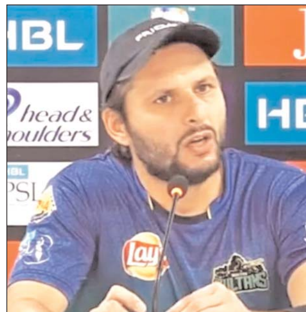
अफरीदी (शाहीन शाह अफरीदी के ससुर) ने बाबर को फिर से सपोर्ट करने के फैसले पर नाराजगी जताई। दरअसल, पाकिस्तान की टीम ने

शुरुआती दो मैचों में मिला हार के बाद पाकिस्तान की टीम के कप्तान बाबर आजम पर पाकिस्तान की टीम ने टी20 विश्व कप 2024 में अपने शुरुआती दो मैचों में हार का सामना