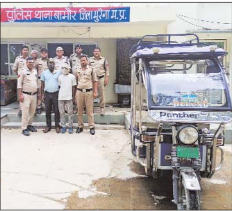
पुलिस थाना बानमोर जिला मुरैना म.प्र.

क्रमांक 209/24 में चोरी गया ई-रिक्शा पर कार्यवाही करते हुए थाना प्रभारी बानमोर मय हमराह फोर्स के मुखबिर द्वारा बताये स्थान लोधी धर्मकांठा गिरवाई, ग्वालियर पर जाकर दबिश दी गई तो दो आरोपी पुलिस को देखकर भागने का प्रयास करने लगे, जिन्हें हमराह फोर्स की मदद से घेरकर पकड़ा गया एवं लोधी धर्मकांठा गिरवाई ग्वालियर के आस-पास चौकिंग की गई तो वहां पर चोरी हुआ ई-रिक्शा क्रमांक एएमपी06 जेसी 1159 रखा हुआ मिला। जिसकी अनुमानित कीमत लगभग 60,000/- रुपये है, जस कर मुरैना लाया गया।