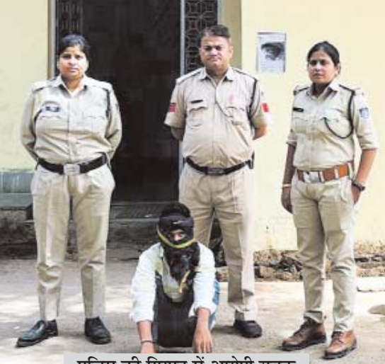
पुलिस की गिरफ्त में आरोपी युवक