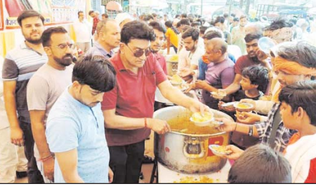
भंडारे का आयोजन