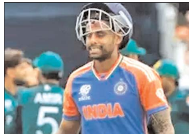
हेड ने टॉप-10 में जगह बनाई है। अफगानिस्तान के अनुभवी खिलाड़ी मोहम्मद नबी ने टी20 ऑलराउंडर की रैंकिंग में शीर्ष स्थान हासिल कर लिया है। उन्होंने न्यूजीलैंड के खिलाफ मैच में दो विकेट चटकाए थे। अफगानिस्तान ने न्यूजीलैंड को 84 रन से हराया था। नबी ने दो स्थान की छलांग लगाई। ऑस्ट्रेलिया के मार्कस स्टायनिस को तीन स्थान का

नई दिल्ली। आईसीसी ने यूएसए और वेस्ट इंडीज में चल रहे टी20 वर्ल्ड कप के बीच आईसीसी ने बुधवार को टी20 रैंकिंग जारी की। जिसमें पाकिस्तान के कप्तान बाबर आजम को एक स्थान का फायदा हुआ है। वह आईसीसी टेनिस टी20 बैटिंग रैंकिंग में तीसरे स्थान पर पहुंच गए हैं। पाकिस्तान के कप्तान बाबर आजम की पिछले कुछ दिनों से खराब प्रदर्शन के लिए जमकर आलोचना हो रही है। भारत के बल्लेबाज सूर्यकुमार यादव एक बार फिर शीर्ष पर बरकरार हैं। क्योंकि वह नंबर 1 टी20 आई बैटर के रूप में अपना वर्चस्व जारी रखते हैं। इंग्लैंड के कप्तान जोस बटलर 5वें स्थान पर पहुंच गए हैं, जबकि ऑस्ट्रेलिया के विस्फोटक सलामी बल्लेबाज ट्रैविस