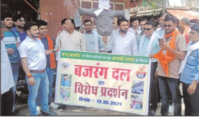
बजरंग दल विरोध प्रदर्शन

है। अगर केंद्र सरकार कड़ी कार्यवाही नहीं करती है तो बजरंगदल देश भर ने उग्र आंदोलन करेगा। जिसकी पूरी जिम्मेवारी शासन प्रशासन की होगी।