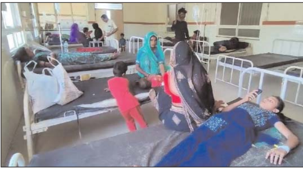
घरेलू उपचार लेकर घर पर ही आराम करने की सोची, जब हालत बिगड़ने लगी, तब वे कैलारस स्वास्थ्य केन्द्र रेफर किया गया है।

अधिक लोगों उल्टी, दस्त और पेट में दर्द की परेशान हुई। पहले ग्रामीणों ने पहुंचे। गांव के कुछ घरों में फैली बीमारी ने महज 24 घंटे में ही सैकड़ों लोगों को अपनी चपेट में ले लिया। उल्टी, दस्त और पेटदर्द से पीड़ित मरीजों को कैलारस अस्पताल में भर्ती कराया गया है। कैलारस बीएमओ ने बताया कि स्वास्थ्य केन्द्र पर भर्ती मरीजों का उपचार किया जा रहा है, जबकि कुछ मरीजों को मुरैना रेफर किया गया है।