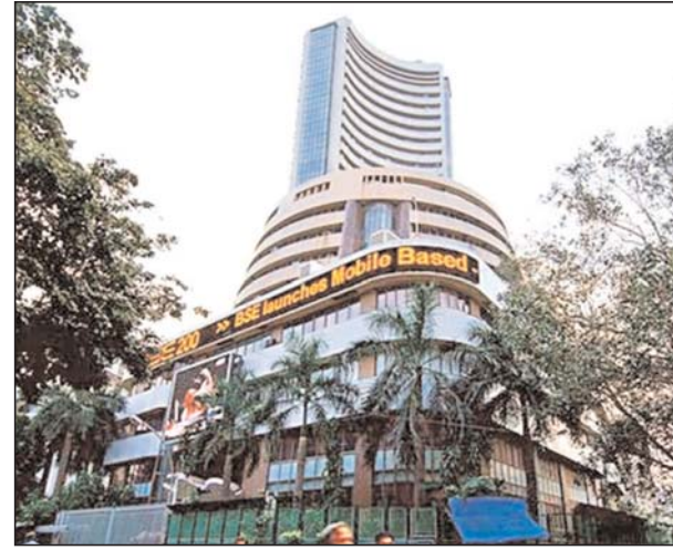
का शेयर ग्रे मार्केट में 38 प्रतिशत यानी 36 प्रतिशत शेयर के प्रीमियम पर

ट्रैवल एग्रीगेटर इक्सिगो की मूल कंपनी ले ट्रैवेल्यूज टेक्नोलॉजिज के इन्वेंशनल पब्लिक ऑफर यानी आईपीओ का (12 जून) आखिरी दिन है। ये आईपीओ रिटेल कैटेगरी में 18 गुना से ज्यादा सब्सक्राइब हो चुका है। लिस्ट होने के पहले कंपनी