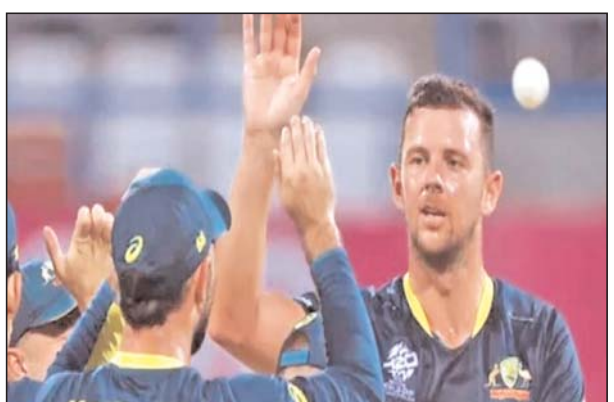
अच्छा प्रदर्शन करो या आप अजेय रहते हुए बेहतर नेट रनरेट के साथ आगे बढ़ो तो भी सुपर 8 में वो खास मायने नहीं रखेगा। इसलिए यह थोड़ा अजीब है लेकिन इसको इसी तरह से तैयार किया गया है। ऑस्ट्रेलियाई टीम रण चरण का चौथा और आखिरी मैच 15 जून को स्कॉटलैंड के

हेजलवुड ने ऑस्ट्रेलिया वर्सेस नामीबिया मैच के बाद मीडिया से कहा, यह वास्तव में थोड़ा अजीब है क्योंकि ऐसा होता नहीं है। मैंने जितने खेले हैं उनमें संभवतः, यह पहला टी20 वर्ल्ड कप है जिसका फार्मेट इस तरह से तैयार किया गया है। इसलिए यह थोड़ा भिन्न है। उन्होंने कहा, यह इस तरह का फार्मेट है कि इसमें पहले चरण में आप कितना भी