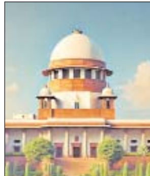
मौजूद रहें। दरअसल, ग्रेप 4 के तहत कंस्ट्रक्शन पर रोक रहती है। कोर्ट ने राज्य सरकारों को आदेश दिया था कि काम बंद होने पर मजदूरों को आर्थिक समस्या का सामना करना पड़ेगा, उन्हें आर्थिक मदद दें। दिल्ली सरकार ने बताया कि उसने 90,000 कंस्ट्रक्शन मजदूरों को तत्काल 5,000 रुपए का भुगतान करने का आदेश दिया है। कुल 13 लाख मजदूर हैं, फिलहाल समस्या वैरिफिकेशन की है।

4 राज्यों के मुख्य सचिवों से पूछा- कितने कंस्ट्रक्शन मजदूरों को मुआवजा दिया, सबूत दें