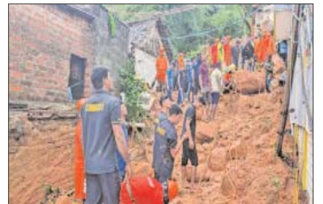
40 टन वजनी चट्टान पहाड़ से लुढ़ककर वीयूसी नगर की सड़क पर बने घाट पर गिरी जिससे 2 घर जमींदोज हो गए। 7 लोगों के मलबे में फंसे होने की

पुडुचेरी। बंगाल की खाड़ी से उठे फेंगल तूफान के असर के चलते सोमवार को केरल, कर्नाटक, तेलंगाना और आंध्र में भारी बारिश हो रही है। फेंगल तूफान 30 नवंबर शाम 7.30 बजे पुडुचेरी के कराईकल और तमिलनाडु के महाबलीपुरम के बीच समुद्र तट से टकराया था। तूफान अब केरल, कर्नाटक, तेलंगाना और आंध्र प्रदेश में पहुंच गया है। तमिलनाडु में तिरुवन्नामलाई में पहाड़ी पर भूस्खलन हुआ। एनडीआरएफ के मुताबिक, लगभग