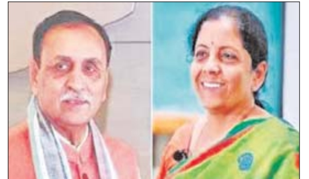
सीएम का नाम तय होगा। 5 दिसंबर को शाम 5 बजे मुंबई के आजाद मैदान में सीएम पद का शपथ ग्रहण. भाजपा की ओर से देवेंद्र फडणवीस का सीएम बनना तय माना जा रहा है। अजित पवार और देवेंद्र फडणवीस की आज दिल्ली में अंतिम शाह से मुलाकात होनी थी। पवार दिल्ली रवाना हो चुके हैं, लेकिन फडणवीस का दौरा अचानक

4 दिसंबर को विधायक दल की बैठक, 5 को शपथ समारोह होगा