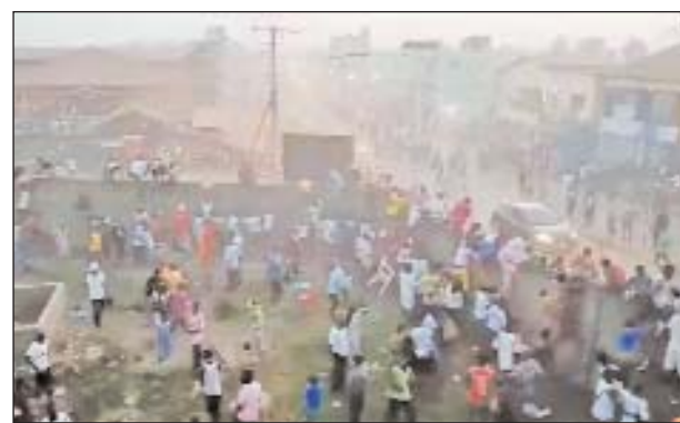
मुर्दाघर भरा हुआ है।

रेफरी के विवादित फैसले पर भड़के लोग, पुलिस स्टेशन जलाया