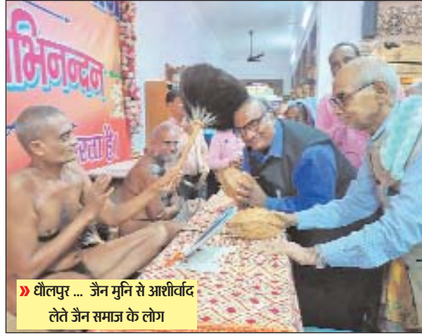
धौलपुर ... जैन मुनि से आशीर्वाद लेते जैन समाज के लोग