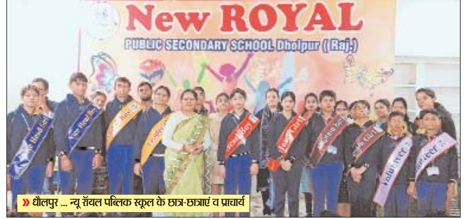
धौलपुर ... न्यू रॉयल पब्लिक स्कूल के छात्र-छात्राएं व प्रचार्य