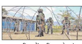
बारामद होने के बाद राज्य में हिंसा भड़कने के बाद 16 नवंबर से इंटरनेट सेवाएं अस्थायी रूप से निलंबित हैं। मणिपुर सरकार ने आम लोगों, स्वास्थ्य सुविधाओं, शैक्षणिक संस्थानों और अन्य कार्यालयों द्वारा सामना की जाने वाली कठिनाइयों को देखते हुए 19 नवंबर को ब्रॉडबैंड सेवाओं (आईएलएल और एफटीडीएच) पर निलंबन सशर्त रूप से हटा दिया था। हालांकि, आदेश में कहा गया था कि ग्राहकों को अनुमति प्राप्त कनेक्शन के अलावा कोई अन्य कनेक्शन स्वीकार नहीं करना चाहिए और किसी भी वाईफाई या वॉलटॉप की अनुमति नहीं दी जानी चाहिए।

आर.एन.एस. इम्फाल। मणिपुर सरकार ने रविवार को राज्य के नौ जिलों में मोबाइल इंटरनेट पर प्रतिबंध को दो दिनों के लिए 3 दिसंबर तक बढ़ा दिया। गृह विभाग द्वारा जारी आदेश में कहा गया है कि इम्फाल पश्चिम, इम्फाल पूर्व, काकचिंग, बिष्णुपुर, थोबल, चुराचंदपुर और कांगपोकपी, फेरजावल और जिरिबाम के क्षेत्रीय अधिकार क्षेत्र में 3 दिसंबर की शाम 5.15 बजे तक मोबाइल इंटरनेट और मोबाइल डेटा सेवाओं सहित वीसेट और वीपीएन सेवाओं के निलंबन को जारी रखने का फैसला किया है। मणिपुर और असम में क्रमशः जिरि और बराक नदियों में तीन महिलाओं और तीन बच्चों के शव