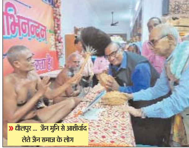
धौलपुर ... जैन मुनि से आशीर्वाद लेते जैन समाज के लोग