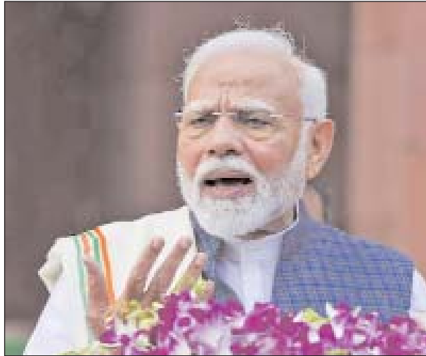
बैठकों में दोनों सदनो में कुल 40 मिनट ही कार्यवाही हो सकी थी। बैठक

इंडिया ब्लॉक की बैठक में टीएमसी नहीं पहुंची, कहा- कांग्रेस सिर्फ अडाणी मुद्दे पर अटक