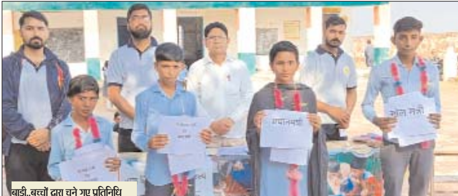
बाड़ी. बच्चों द्वारा चुने गए प्रतिनिधि

बाड़ी। उपखंड के धन्नु का पुरा गांव में सोमवार को मैजिक बस इंडिया फाउंडेशन द्वारा राजकीय उच्च माध्यमिक विद्यालय में बाल कैबिनेट का गठन किया गया। इस कार्यक्रम का उद्देश्य विद्यार्थियों में नेतृत्व क्षमता, जिम्मेदारी और जागरूकता को बढ़ावा देना है। कार्यक्रम के दौरान विद्यालय के छात्रों ने बड़े उत्साह के साथ भाग लिया। बाल कैबिनेट के तहत विभिन्न पदों का गठन किया गया, जिनमें प्रधानमंत्री, शिक्षा मंत्री, स्वास्थ्य मंत्री, पर्यावरण मंत्री और सांस्कृतिक मंत्री जैसे पद शामिल रहे। चयन प्रक्रिया के दौरान छात्रों ने अपने विचार प्रस्तुत किए और मतदान के माध्यम से कैबिनेट का चयन किया गया। इस अवसर पर विद्यालय के प्रधानाचार्य और मैजिक बस इंडिया फाउंडेशन के प्रतिनिधियों