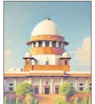
मौजूद रहें। दरअसल, ग्रेप 4 के तहत कंस्ट्रक्शन पर रोक रहती है। कोर्ट ने राज्य सरकारों को आदेश दिया था कि काम बंद होने पर मजदूरों को आर्थिक समस्या का सामना करना पड़ेगा, उन्हें आर्थिक मदद दें। दिल्ली सरकार ने बताया कि उसने 90,000 कंस्ट्रक्शन मजदूरों को तत्काल 5,000 रुपए का भुगतान करने का आदेश दिया है। कुल 13 लाख मजदूर हैं, फिलहाल समस्या वैरिफिकेशन की है।

4 राज्यों के मुख्य सचिवों से पूछा- कितने कंस्ट्रक्शन मजदूरों को मुआवजा दिया, सबूत दें