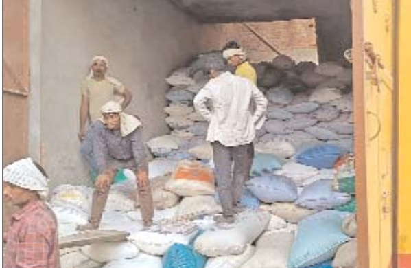
में सूचना मिली थी जिसके बाद जिला कलेक्टर के निर्देश पर राजाखेड़ा के