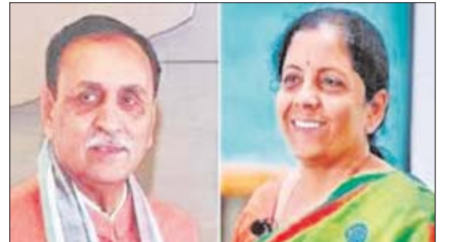
सीएम का नाम तय होगा। 5 दिसंबर को शाम 5 बजे मुंबई के आजाद मैदान में सीएम पद का शपथ ग्रहण। भाजपा की ओर से देवेंद्र फडणवीस का सीएम बनना तय माना जा रहा है। अजित पवार और देवेंद्र फडणवीस की आज दिल्ली में अमित शाह से मुलाकात होनी थी। पवार दिल्ली रवाना हो चुके हैं, लेकिन फडणवीस का दौरा अचानक रद्द हो गया है। विधानसभा चुनाव में महायुक्ति को 230 सीटें मिली हैं। बहुमत के लिए जरूरी 145 विधायकों से 85 सीटें ज्यादा। भाजपा को 132, शिवसेना शिंदे को 57 और एनसीपी अजित पवार को 41 सीटें मिली हैं। महायुक्ति की बैठक 4 दिसंबर और शपथ ग्रहण समारोह 5 दिसंबर को होगा।

4 दिसंबर को विधायक दल की बैठक, 5 को शपथ समारोह होगा