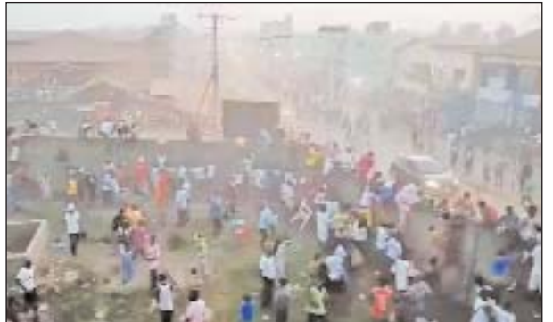
मुर्दाघर भरा हुआ है। यह मैच गिनी सेना के आर्मी जनरल मामाडी डोम्बोया के सम्मान में हो रहा था। डोम्बोया ने साल 2021 में गिनी में तख्तापलट करके सत्ता पर कब्जा कर लिया था। डोम्बोया ने सितंबर 2021 में राष्ट्रपति अल्फा कोर्टे की सरकार को गिरा दिया था और खुद सत्ता पर कब्जा कर लिया था। अंतरराष्ट्रीय दबाव के कारण उन्होंने कहा था कि 2024 के अंत तक वे चुनाव कराएंगे, लेकिन अब तक चुनाव के आसार नहीं दिख रहे हैं।

रेफरी के विवादित फैसले पर भड़के लोग, पुलिस स्टेशन जलाया