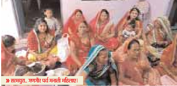
» सरमथुरा...गणगौर पर्व मनाती महिलाएं।

सरमथुरा। भारतीय संस्कृति में तीज त्योहार की परंपरा अनूठी है। तीज त्योहार भारतीय संस्कृति में अलग महत्व और पहचान रखते हैं। ऐसा ही एक त्योहार गणगौर का है जिसे पूजने के लिए सुहागिन महिलाएं और कुंवारी कन्या बेसब्री से इंतजार करती हैं। होली के बाद से ही गणगौर की पूजा अर्चना का दौर शुरू हुआ और 16 दिन बाद गुरुवार को गणगौर का पर्व परंपरा और उत्साह के साथ ही श्रद्धा पूर्वक मनाया गया। विशेषकर सुहागिन महिलाएं और कुंवारी कन्या अमर सुहाग दात्रि गणगौर माता और इंसर की पूजा अर्चना करती हैं और गणगौर की कहानी सुनकर आशीर्वाद मांगती हैं कि उनके परिवार में सुख शांति हो