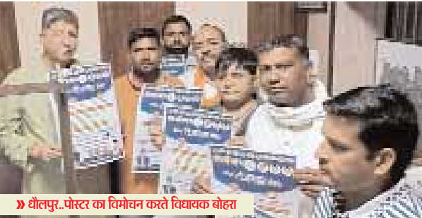
» धौलपुर...पोस्टर का विमोचन करते विधायक बोहरा