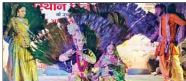
धौलपुर...कार्यक्रम में मनमोहक प्रस्तुति देते कलाकार।

सांस्कृतिक कार्यक्रम की शुरुआत पारंपरिक लोकगीतों से हुई, जिसमें स्थानीय और प्रख्यात राजस्थानी कलाकारों ने अपनी सुमधुर प्रस्तुतियों से दर्शकों को मंत्रमुग्ध कर दिया। बृज की रासलीला ने भक्तिमय वातावरण का संचार किया, वहीं चरकुला नृत्य और मयूर नृत्य ने कार्यक्रम को भव्यता प्रदान की। फूलों की होली ने उत्सव को और भी रंगीन बना दिया, जिससे दर्शक मंत्रमुग्ध हो उठे। दीपदान कार्यक्रम में नागरिकों, सामाजिक संस्थाओं और अधिकारियों ने हिस्सा लिया। हजारों दीपों की ज्योतियों से मचकुंड धाम जगमगा उठा, जिससे यह दृश्य किसी स्वर्गीय आभा से कम नहीं लग रहा था। कार्यक्रम में जिला कलेक्टर