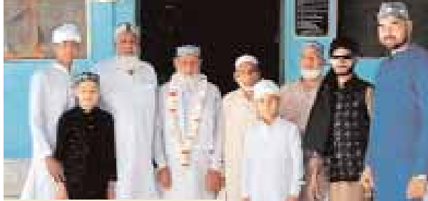
» धौलपुर...करबला में ईद की बधाई देते हुए