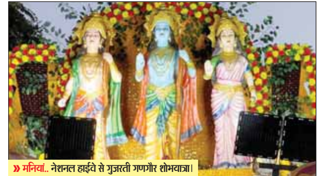
मनियां...नेरवल हाईवे से गुजरती गणगौर शोभायात्रा।

उसके बाद थाने के पास से शाम 5 बजे झांकियां शुरू हुई जो जीटी रोड, मांगरोल रोड, मेन बाजार, गांधी पार्क, नेहरु मार्ग एवं अंबेडकर पार्क होते हुए