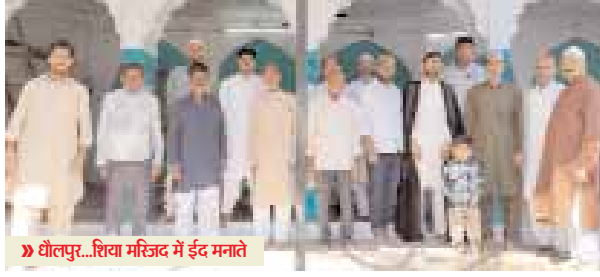
» धौलपुर...शिया मस्जिद में ईद मनाते