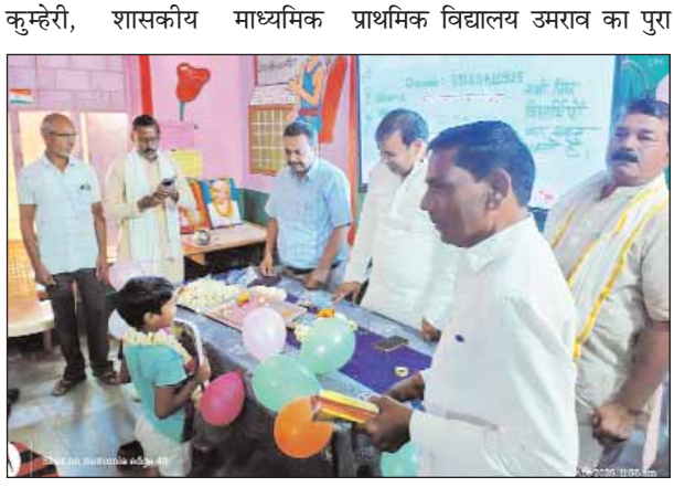
कुम्हरी, शासकीय माध्यमिक प्राथमिक विद्यालय उमराव का पुरा विद्यालय विसंगपुरा, शासकीय शासकीय माध्यमिक विद्यालय