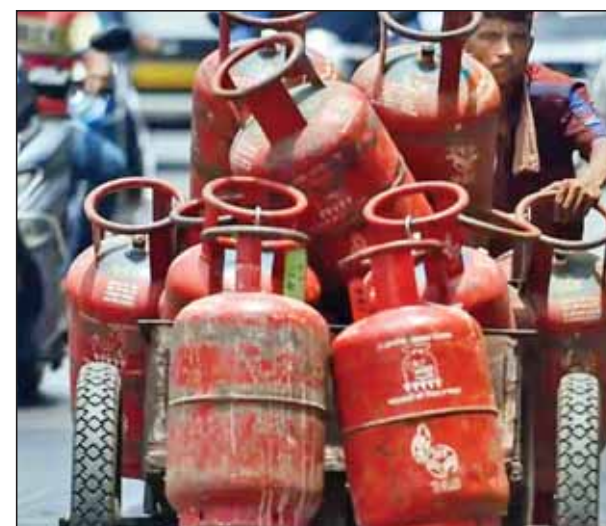
किलोग्राम वाले कमर्शियल एलपीजी गैस सिलेंडर की कीमतों में इजाफा हुआ था। तब यह दरें 25 रुपये बढ़ाई

सिलेंडर हो गई थी। इससे भी पहले फरवरी में केंद्रीय आम बजट से पहले लोगों के लिए एक राहत भरी खबर आई थी। तब तेल विपणन कंपनियों ने कमर्शियल एलपीजी गैस सिलेंडर की कीमतों में सात रुपये की कटौती की थी। तब दिल्ली में इस सिलेंडर की खुदरा बिक्री कीमत 1797 रुपये हो गई थी।