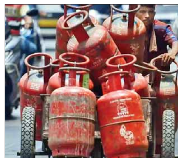
किलोग्राम वाले कमर्शियल एलपीजी गैस सिलेंडर की कीमतों में इजाफा हुआ था। तब यह दरें 25 रुपये बढ़ाई

नई दिल्ली। महीने की पहली तारीख कुछ लोगों के लिए राहत लेकर आई है। दरअसल, एलपीजी गैस सिलेंडर की कीमतों में कटौती का एलान किया गया है। तल कंपनियों की कीमतों में 41 रुपये की कटौती की गई है। महंगाई की मार के बीच इसे राहत के तौर पर देखा जा रहा है। जानकारी के मुताबिक, तेल विपणन कंपनियों ने वाणिज्यिक एलपीजी गैस सिलेंडर की कीमतों में संशोधन किया है। 19 किलोग्राम वाले वाणिज्यिक एलपीजी गैस सिलेंडर की कीमत में आज से 41 रुपये की कटौती की गई है। दिल्ली में 19 किलोग्राम वाले वाणिज्यिक एलपीजी सिलेंडर की खुदरा बिक्री कीमत आज से 1762 रुपये हो गई है। इससे पहले पिछले महीने 19