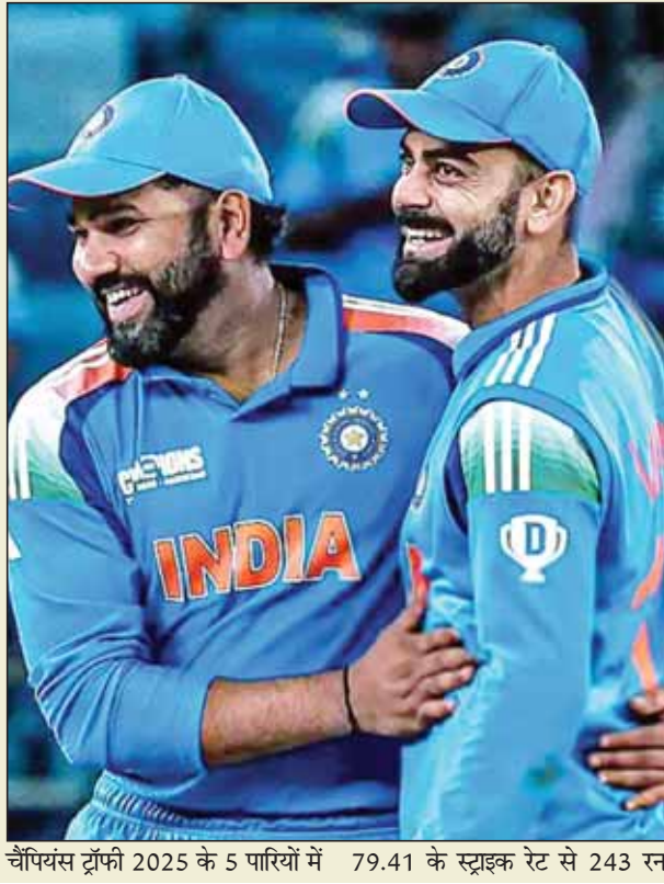
चैंपियंस ट्रॉफी 2025 के 5 पारियों में 79.41 के स्ट्राइक रेट से 243 रन

अय्यर ने चैंपियंस ट्रॉफी में करीब 49 की औसत से बनाए रन अय्यर