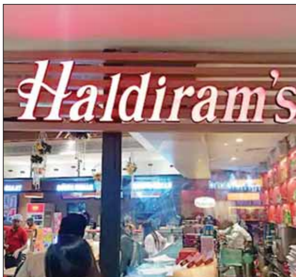
रुपए) में हुई थी। हल्दीराम ने बताया कि टेमासेक ने कंपनी के मौजूदा शेयर होल्डर्स के 10वें हिस्सेदारी को खरीदा है। ब्लैकस्टोन भी 20 प्रतिशत

इससे पहले 30 मार्च को सिंगापुर की सांविन इन्वेस्टमेंट फर्म टेमासेक ने हल्दीराम के सैक्स डिवीजन में 10 प्रतिशत हिस्सेदारी खरीदने के लिए एग्रीमेंट किया था। यह डील 1 बिलियन डॉलर (करीब 8,555 करोड़