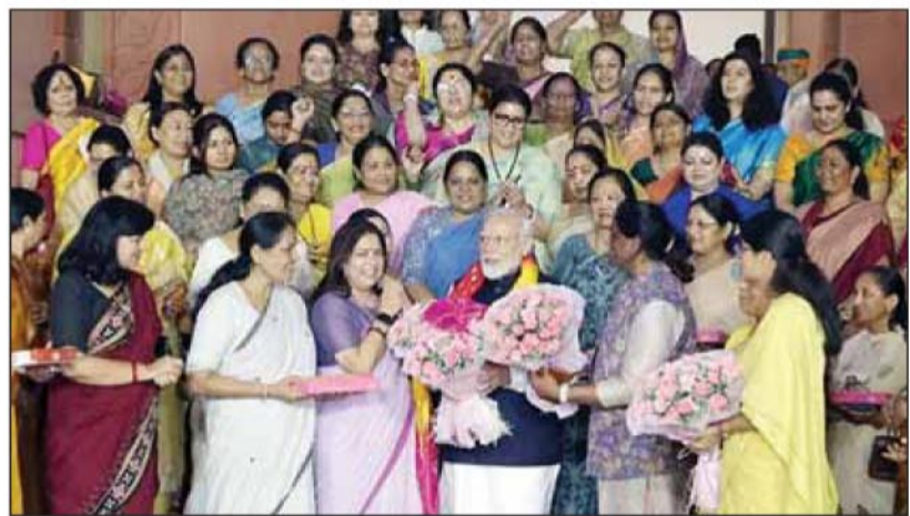
2011 की जनगणना के आधार पर किया जा सकता है। यह कानून राज्यों की विधानसभाओं और दिल्ली, जम्मू-कश्मीर, पुडुचेरी जैसे केंद्र शासित प्रदेशों में भी लागू किया जाएगा।

और कहा- संसद, सभी दलों से ऊपर उठकर, भारत की महिलाओं के लिए इस महत्वपूर्ण कदम के समर्थन लाएगी। ताकि नए सिरे से सीटों का निर्धारण हो सके। नई सीटों का निर्धारण 2027 की जनगणना के बजाय 2011 की जनगणना के आधार पर किया जा सकता है। यह कानून राज्यों की विधानसभाओं और दिल्ली, जम्मू-कश्मीर, पुडुचेरी जैसे केंद्र शासित प्रदेशों में भी लागू किया जाएगा।