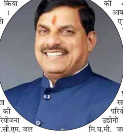
उद्योगों हेतु 17.4 मि.घ.मी. जल उपलब्ध होगा। दिसंबर 2024 में जयपुर में 'पार्वती-कालीसिंध-चंबल नदी जोड़ी परियोजना' का अनुबंध सहमति पत्र (मेमोरेंडम ऑफ एग्रीमेंट) भारत सरकार राजस्थान एवं मध्यप्रदेश के मध्य हस्ताक्षरित किया गया। पार्वती-कालीसिंध-चंबल लिंक परियोजना अंतर्गत परियोजना समूह की लागत 31479.48 करोड़ रुपये की प्रशासकीय स्वीकृति मध्यप्रदेश शासन द्वारा जारी की गई है। यह परियोजना मध्यप्रदेश के चंबल और मालवा क्षेत्र के जिलों में जल आपूर्ति में महत्वपूर्ण भूमिका निभाएगी। संशोधित पार्वती-कालीसिंध-चंबल लिंक परियोजना से लगभग 7 लाख 84 हजार कुश्कों के जीवन में समृद्धि और खुशहाली आएगी। इस लिंक परियोजना के अंतर्गत 22 वृहद सिंचाई परियोजना के निर्माण के साथ ही 60 वर्ष पुरानी चम्बल

सीहोर, शाजापुर, देवास, राजगढ़, मंदसौर, आगर-मालवा एवं इंदौर के 2012 ग्रामों की लगभग 6 लाख 15 हजार हेक्टेयर भूमि में सिंचाई हेतु जल उपलब्ध होगा। मालवा एवं चंबल क्षेत्र के 11 जिलों की 43 लाख आबादी को 61 एम.सी.एम. जल आरक्षित किया जा कर पेयजल की सुविधा प्राप्त होगी। साथ ही परियोजना से उद्योगों हेतु 17.4 मि.घ.मी. जल उपलब्ध होगा। दिसंबर 2024 में जयपुर में 'पार्वती-कालीसिंध-चंबल नदी जोड़ी परियोजना' का अनुबंध सहमति पत्र (मेमोरेंडम ऑफ एग्रीमेंट) भारत सरकार राजस्थान एवं मध्यप्रदेश के मध्य हस्ताक्षरित किया गया। पार्वती-कालीसिंध-चंबल लिंक परियोजना अंतर्गत परियोजना समूह की लागत 31479.48 करोड़ रुपये की प्रशासकीय स्वीकृति मध्यप्रदेश शासन द्वारा जारी की गई है। यह परियोजना मध्यप्रदेश के चंबल और मालवा क्षेत्र के जिलों में जल आपूर्ति में महत्वपूर्ण भूमिका निभाएगी। संशोधित पार्वती-कालीसिंध-चंबल लिंक परियोजना से लगभग 7 लाख 84 हजार कुश्कों के जीवन में समृद्धि और खुशहाली आएगी। इस लिंक परियोजना के अंतर्गत 22 वृहद सिंचाई परियोजना के निर्माण के साथ ही 60 वर्ष पुरानी चम्बल