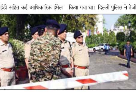
आईडी सहित कई आधिकारिक ईमेल किया गया था। दिल्ली पुलिस ने तेजी से कार्रवाई करते हुए बम निरोधक दस्तों और खोजी कुत्तों की इकाइयों के साथ मिलकर विधानसभा परिसर, सचिवालय, चिह्नित स्कूलों और मेट्रो

नई दिल्ली। दिल्ली विधानसभा समेत कई सरकारी कार्यालयों को बृहस्पतिवार को बम से उड़ाने की धमकी संबंधी ईमेल मिले। इसके बाद सुरक्षा एजेंसियों में हड़कंप मच गया। इसके बाद राष्ट्रीय राजधानी में प्रमुख सरकारी प्रतिष्ठानों और सार्वजनिक स्थानों पर व्यापक सुरक्षा जांच शुरू की गई। जांच के बाद सभी जगह बम होने की सूचना झूठी निकली। दिल्ली पुलिस के एक वरिष्ठ अधिकारी ने बताया कि यह ईमेल सुबह 8.14 बजे विधानसभा और दिल्ली सरकार के कार्यालयों से जुड़ी ईमेल