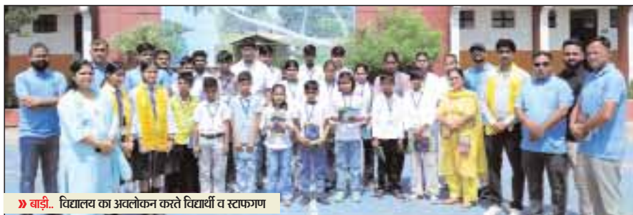
बाड़ी... विद्यालय का अस्लोकन करते दिद्यार्थी व स्टाफमण