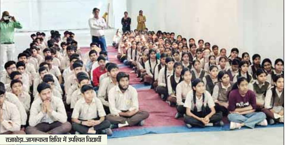
राजाखेड़ा...जागरूकता शिविर में उपस्थित विद्यार्थी