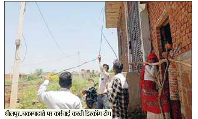
धौलपुर...बकायेदारों पर कार्रवाई करती डिस्कॉम टीम