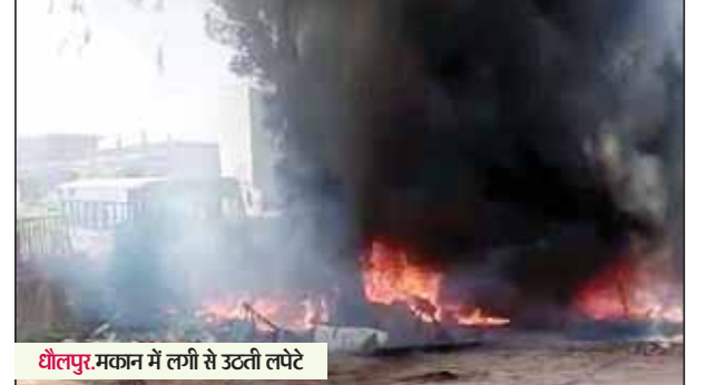
धौलपुर...मकान में लगी से उटती लपटे

धौलपुर। शहर के हरदेव सिंह संसार सिंह नगर में शुक्रवार दोपहर को एक मकान में अचानक शॉर्ट सर्किट से आग लग गई। आग लगते ही घर के लोगों में अफरा-तफरी मच गई और आग बुझाने के प्रयास में लग गये। जब तक आग पर काबू पाया जाता तब तक आग की चपेट में आने से घर में रखी 2 बाईक, 100 मन भूषा, 1 फ्रिज व 35 बैटरी बस की तथा 2 टायर, एक कुलर सहित अन्य सामान जलकर राख हो