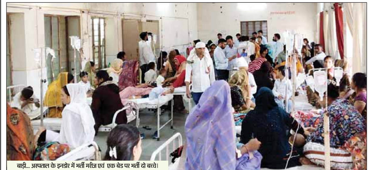
बाड़ी... अस्पताल के इन्डोर में भर्ती मरीज एवं एक बेड पर भर्ती दो बच्चे।