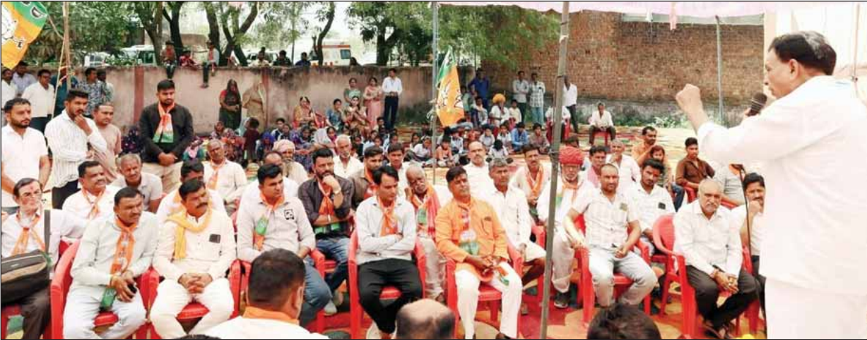
'गांव चलो अभियान' में विभिन्न गांवों में पहुंचे