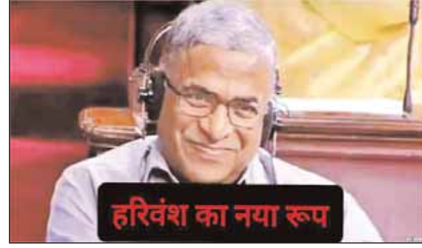
हरिवंश का नया रूप

राज्यसभा के उपसभापति रहे हरिवंश को फिर से राज्यसभा की सदस्यता मिल गई है। उन्हे इस बार जेडयू ने राज्यसभा नहीं भेजा था। लेकिन भाजपा सरकार के निर्णय पर राष्ट्रपति श्रीमती द्रौपदी मुर्मू को हरिवंश को राज्यसभा में मनोनीत करना पड़ा। राष्ट्रपति भवन से जारी अधिसूचना में कहा गया है कि एक मनोनीत सांसद के रिटायरमेंट से जो रिक्ति हुई है, उस स्थान पर हरिवंश को मौका दिया गया है। अब वह फिर से राज्यसभा सांसद होंगे।