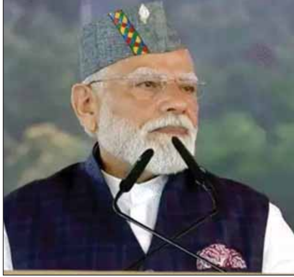
वाइल्ड लाइफ कारिडोर का निरीक्षण करने सहरनपुर पहुंचे। यहां रोड शो

पीएम ने कहा, 'कभी उत्तराखंड के गांव में सड़क के इंतजार में पीढ़ियां बदल जाती थीं। आज डबल इंजन सरकार के प्रयास से सड़क गांव तक पहुंच रही है। जो गांव वीरान थे आज फिर बस रहे हैं।' इससे पहले उन्होंने दिल्ली-देहरादून एक्सप्रेसवे कारिडोर का उद्घाटन किया। वे एशिया के सबसे लंबे 12 किमी एलिवेटेड