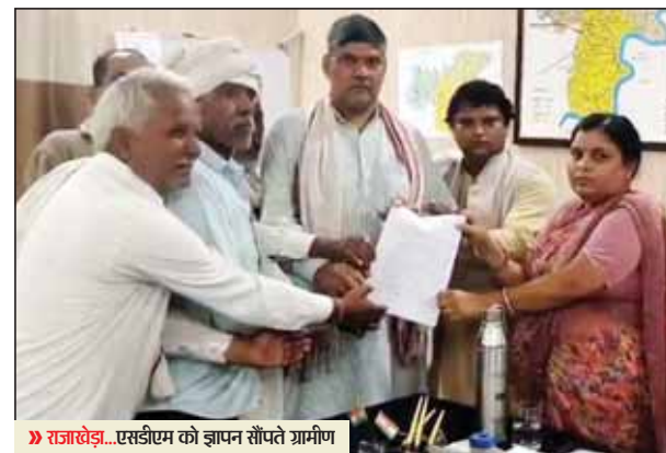
राजाखेड़ा...एसडीएम को ज्ञापन सौंपते ग्रामीण