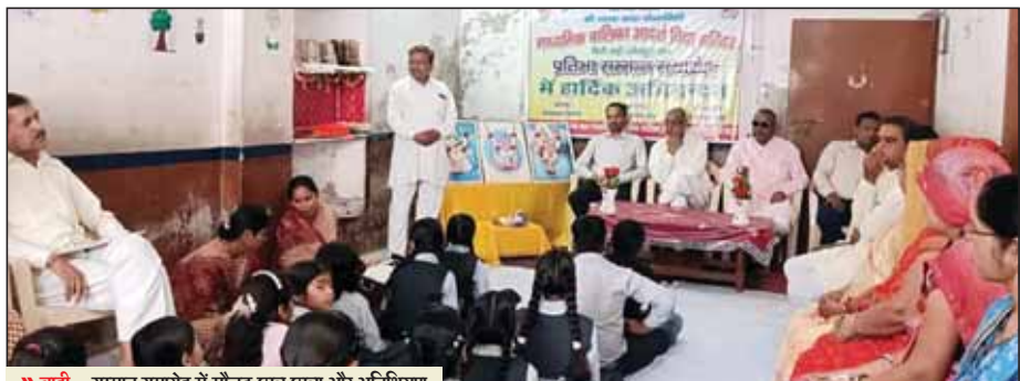
बाड़ी... सम्मान समारोह में मौजूद छात्र छात्रा और अतिथिगण