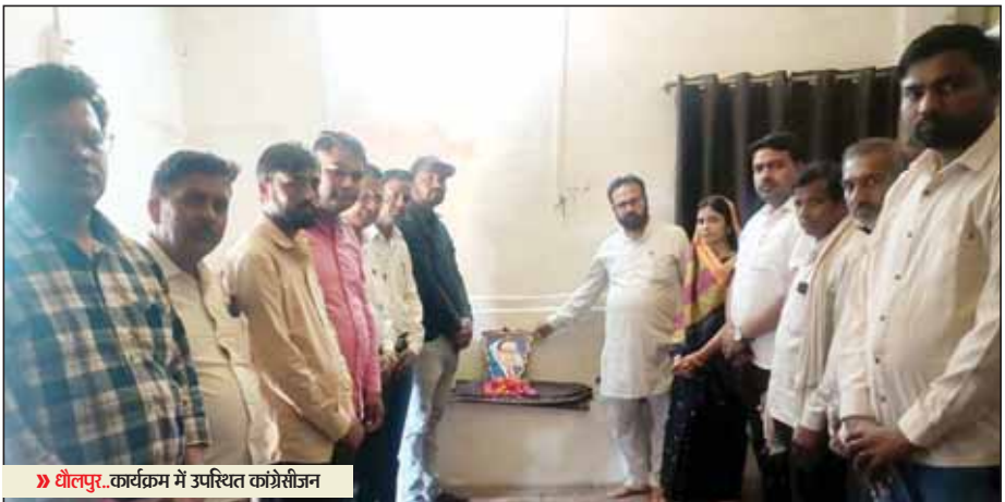
धौलपुर... कार्यक्रम में उपस्थित कांग्रेसीय

डॉ. भीमराव अंबेडकर की जयंती पर पुष्पांजलि सभा का आयोजन