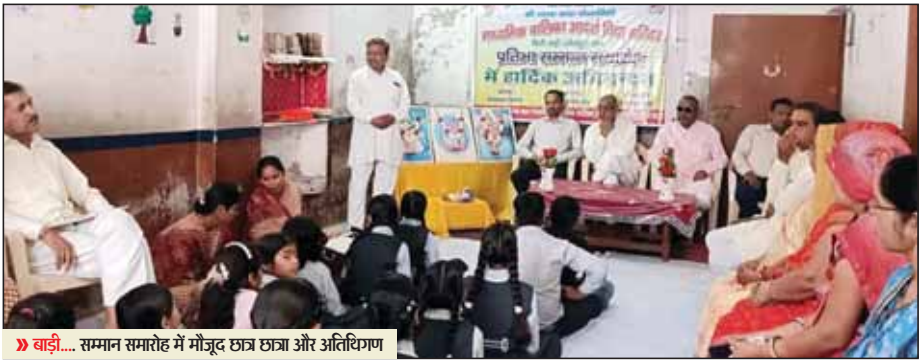
बाड़ी... सम्मान समारोह में मौजूद छात्र छात्रा और अतिथिगण