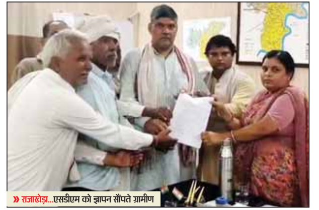
राजाखेड़ा...एसडीएम को ज्ञापन सौंपते ग्रामीण