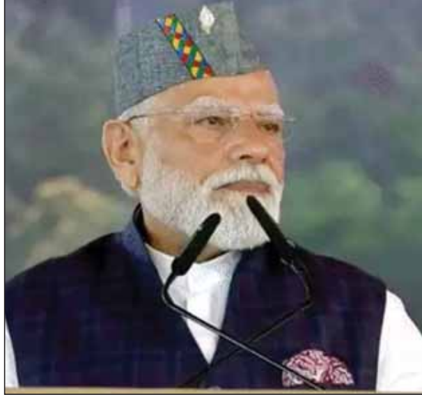
वाइल्ड लाइफ कॉरिडोर का निरीक्षण करने सहरनपुर पहुंचे। यहां रोड शो

नई दिल्ली। पीएम मोदी ने मंगलवार को देहरादून में कहा, '4 दशकों से महिला-बेटियां अपने हक का इंतजार कर रही हैं। अब वह समय आ गया है। हम अपने देश की बेटियों को 2029 के चुनावों में उनका हक देकर रहेंगे। इसके लिए हम संसद में महिला आरक्षण बिल ला रहे हैं।' पीएम ने कहा, 'कभी उत्तराखंड के गांव में सड़क के इंतजार में पीढ़ियां बदल जाती थीं। आज डबल इंजन सरकार के प्रयास से सड़क गांव तक पहुंच रही है। जो गांव वीरान थे आज फिर बस रहे हैं।' इससे पहले उन्होंने दिल्ली-देहरादून एक्सप्रेसवे कारिडोर का उद्घाटन किया। वे एशिया के सबसे लंबे 12 किमी एलिवेटेड