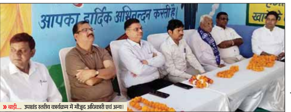
बाड़ी... उपखंड स्तरीय कार्यक्रम में मौजूद अधिकारी एवं अन्य।