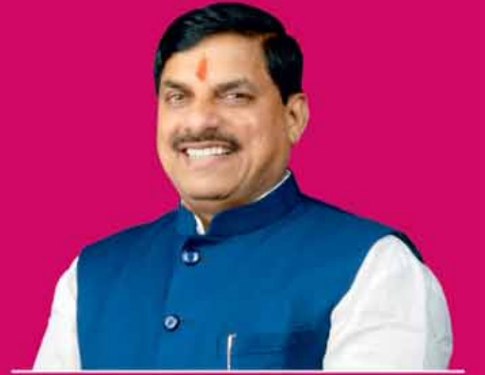
डॉ. मोहन यादव मुख्यमंत्री, मध्यप्रदेश