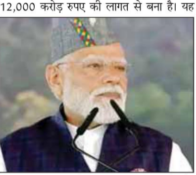
दिल्ली, उत्तर प्रदेश और उत्तराखंड को जोड़ता है और इसके शुरू होने से दिल्ली-देहरादून के बीच की दूरी 6 घंटे से घटकर करीब ढाई घंटे रह जाएगी।

देहरादून। पीएम मोदी ने मंगलवार को देहरादून में कहा, '4 दशकों से महिला-बेटियाँ अपने हक का इंतजार कर रही हैं। अब वह समय आ गया है। हम अपने देश की बेटियों को 2029 के चुनावों में उनका हक देकर रहेंगे। इसके लिए हम संसद में महिला आरक्षण बिल ला रहे हैं।' पीएम ने कहा, 'कभी उत्तराखंड के गांव में सड़क के इंतजार में पीढ़ियाँ बदल जाती थीं। आज डबल इंजन सरकार के प्रयास से सड़क गांव तक पहुंच रही है। जो गांव वीरान थे आज फिर बस रहे हैं।'