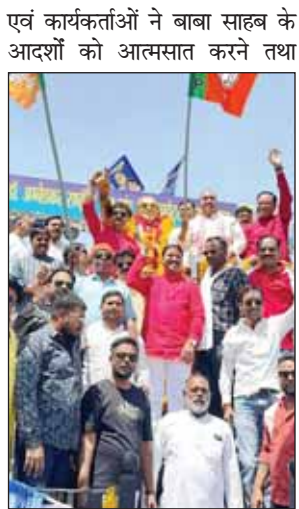
समाज में समावेशिता और समानता की भावना को बढ़ावा देने का संकल्प लिया। कार्यक्रम की अध्यक्षता भाजपा अनुसूचित जाति मोर्चा के जिला