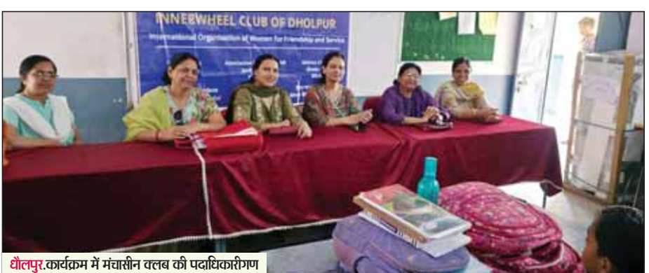
धौलपुर...कार्यक्रम में मंत्रालीन क्लब की पदाधिकारीगण