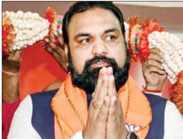
कार्यक्रम में मौजूद थे। बिहार में अभी मंत्रिमंडल का ऐलान नहीं किया गया

नई दिल्ली। सम्राट चौधरी बिहार 24वें मुख्यमंत्री बन गए हैं। उन्होंने ईश्वर के नाम पर शपथ ली। राज्यपाल सेयद अता हसन ने लोकभवन में सुबह 11 बजे उन्हें पद और गोपनीयता की शपथ दिलाई। बिहार की नई सरकार में जदयू से विजय चौधरी और बिजेन्द्र यादव ने भी शपथ ली। दोनों को डिप्टी सीएम बनाया गया है। नीतीश कुमार इस