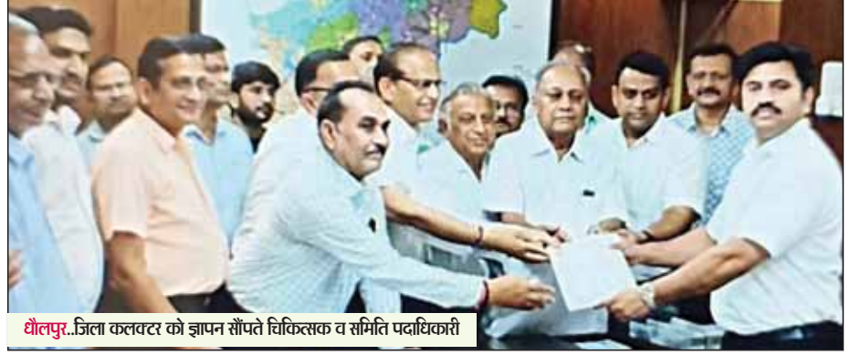
धौलपुर...जिला कलेक्टर को ज्ञापन सौंपते चिकित्सक व समिति पदाधिकारी