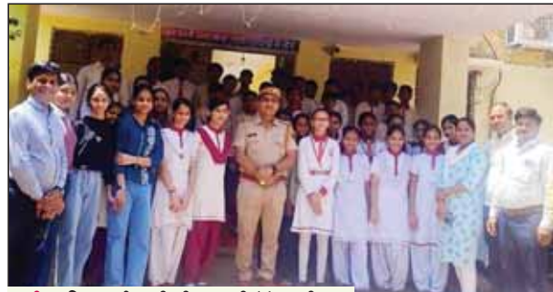
बाड़ी... पुलिस कार्यप्रणाली की जानकारी लेते स्कूली छात्र

विद्यार्थियों द्वारा एक विशेष शैक्षिक भ्रमण का आयोजन