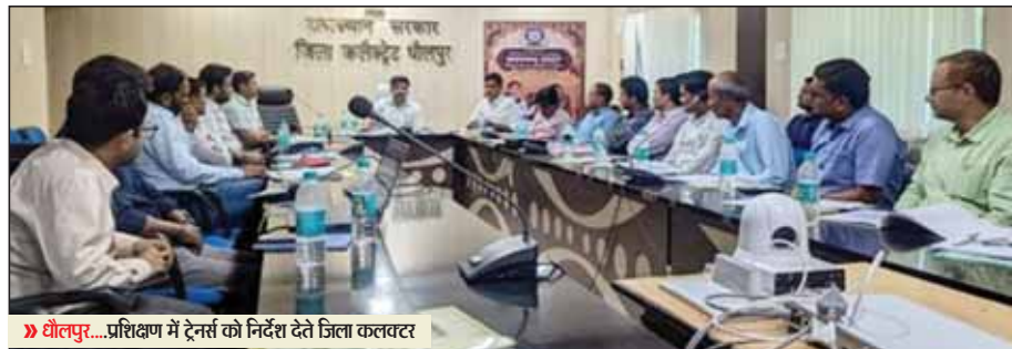
धौलपुर... प्रशिक्षण में ट्रेनर्स को निर्देश देते जिला कलेक्टर