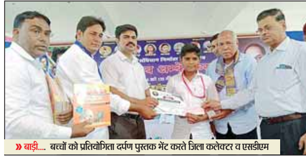
धौलपुर... बच्चों को प्रतियोगिता दर्पण पुस्तक भेंट करते जिला कलेक्टर व एसडीएम