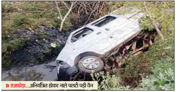
राजाखेड़ा...अभिहित होकर नाले पतटी पड़ी वैन

राजाखेड़ा। राजाखेड़ा सिलावट रोड पर पप्पू ईट भट्ट के सामने एक वैन आरजे 11सीबी0341 वैन सड़क के बाल नाले में गिर गई। जिससे कोई जान मान की घटना तो नहीं हुई है, लेकिन वैन में एक निजी स्कूल के चार छोटे-छोटे बच्चे बैठे बताए गए हैं। जिनमें तीन बच्चे एक बच्ची शामिल है। बच्चे अपने स्कूल के लिए पढ़ने जाने बताए जा रहे हैं जिनको ड्राइवर एवं अन्य लोगों ने बाहर निकाला। लेकिन निजी स्कूल के किसी अध्यापक के द्वारा बच्चों के घर बच्चों का नाम वह स्कूल का नाम नहीं बताने की मना करने पर वाहन खाली आना बता रहे हैं जो कि राजाखेड़ा की तरफ आ रही थी। यह घटना सुबह करीबन 7:45 बजे की है। सूत्रों से मिली जानकारी में वैन