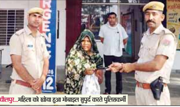
धौलपुर...महिला को खोया हुआ मोबाइल सुपुर्द करते पुलिसकर्मी