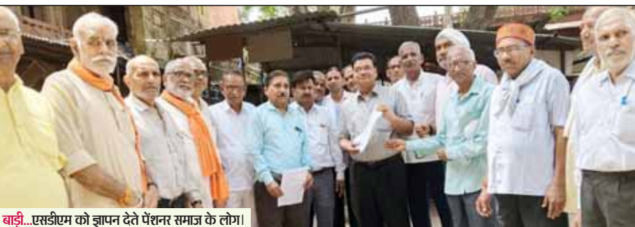
बाड़ी...एसडीएम को ज्ञापन देते पेंशनर समाज के लोग।

रैली निकालकर एसडीएम को दिया सीएम और दिया कुमारी के नाम ज्ञापन