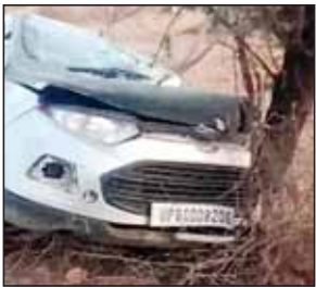
बजरंग दल और गौ सेवकों ने जताई तस्करी की आशंका, आरोपी आगरा के ताजगंज निवासी

कंचनपुर पुलिस ने आरोपी चालक को लिया हिरासत में, पूछताछ जारी