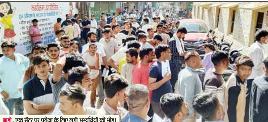
बाड़ी... एक सेंटर पर परीक्षा के लिए लगी अभ्यर्थियों की भीड़।

शहर में दो सेंटर्स पर हुई परीक्षा, समय से नहीं आये तो कई अभ्यर्थी लौटे वापस