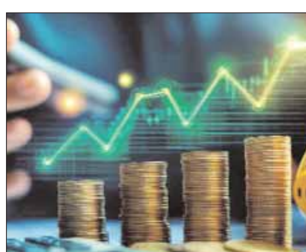
डॉलर की पूंजी जुटाई है। क्या कहते हैं आरबीआई के